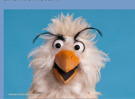
Foto: Raaf, uit een poppenspel van Max Verstappen (ontwikkelaar poppenspel Themajaar Verzet)

Er worden door de verschillende musea, instellingen en organisaties veel expertise en middelen gestoken in educatieve programma's die uiterst actueel zijn en die met weinig middelen breder kunnen worden ingezet. Zo komt er een educatieve tool beschikbaar die door een ieder kan worden afgenomen en er wordt een poppenspel ontwikkeld voor de allerkleinsten.